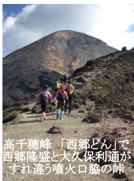
高千穂峰「西郷どん」で 西郷隆盛と大久保利通が すれ違う噴火口脇の峠

7人のメンバー(男子3・女子4 my hus 含)で登山部な るものを結成し、時々山に登ってます。2009年標高 1300mにそびえる屋久島縄文杉まで登ったのが始まり。 子供たちの送迎という任務から解放され、いき