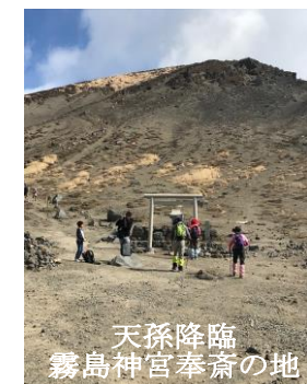
天孫降臨 霧島神宮奉斎の地

あれは大失敗。吸引力が求められ逆に疲れるという 代物。9年間で“なんちゃって登山部”に必要な物は 大方揃いました。この登山部、誰かが言い出せば行 ってみようかというアバウトチーム。紅葉の時期と