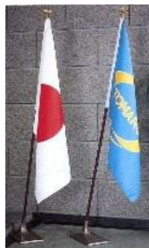
インドアスタンド