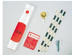
家庭用国旗セット